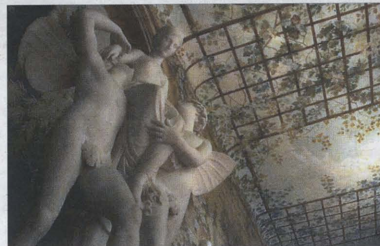
♦ „Inwentorium śladów” braci Quay to wyraz ich fascynacji zamkiem w Łańcucie